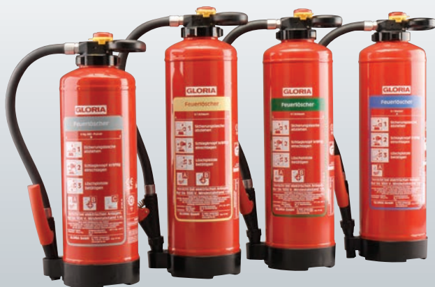
Pulver Schaum Öko-Tipp Wasser