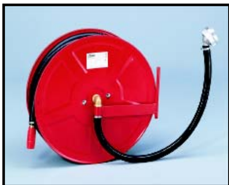
Abbildung als komplette Haspel (d.h. zusätzlich mit Haspel, Strahlrohr, und Zuführungsschlauch)