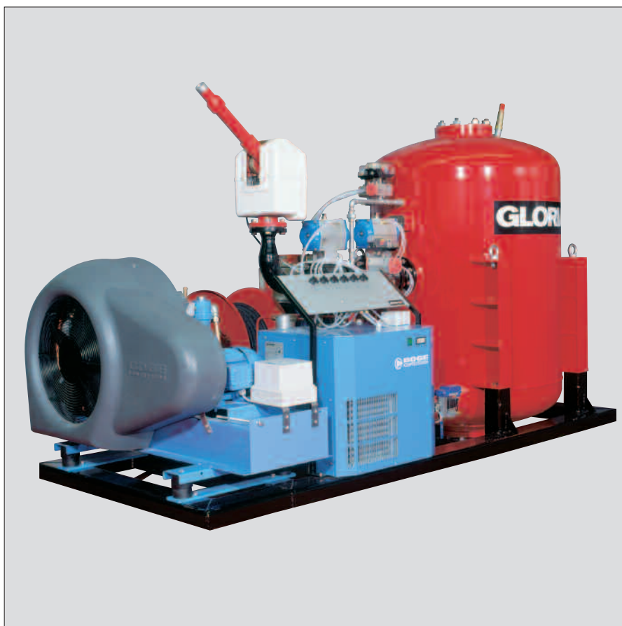
Abbildung: HD-PLA 1000