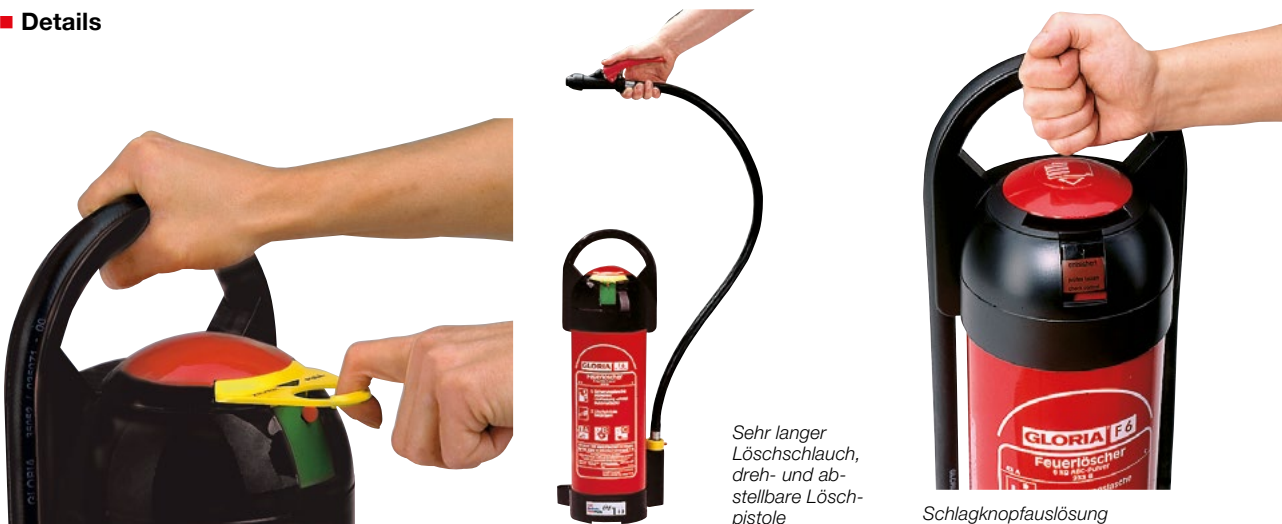
Ziehen der gelben Sicherungslasche