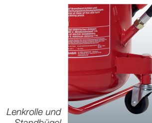
Lenkrolle und Standbügel