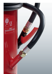
Dreh- und abstellbare Löschpistole