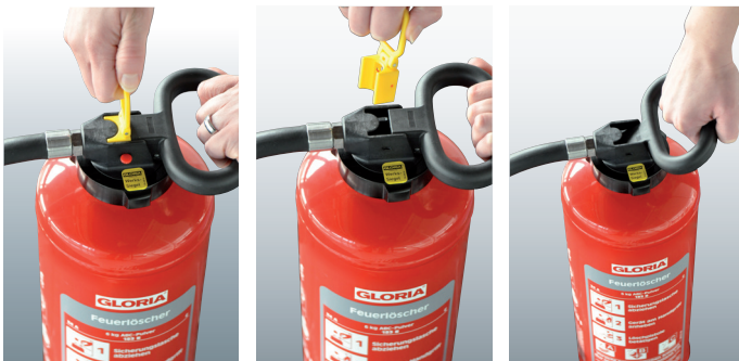
Entsichern, anheben, fertig!