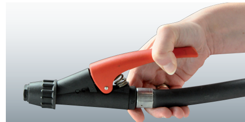
Dreh- und abstellbare Löschpistole