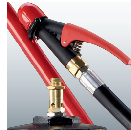
Dreh- und abstellbare Löschpistole