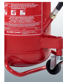
Lenkrolle und Standbügel