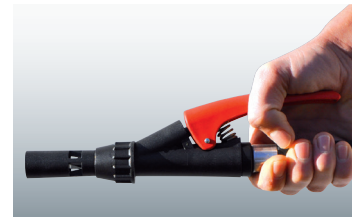
Dreh- und abstellbare Löschkpistole